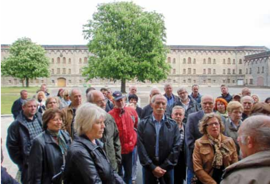
Stimmungsbild der Besichtigung der Bundesfestung Ulm vor dem Eingang der Wilhelmsburgkaserne.